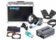
Kobold DWO 400 plus SET