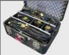
Dedolight Koffer 3 x 150 W Dimmbar Stative