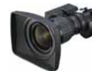
Canon SD J11ex4.5B ITS-ME