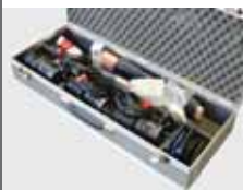
Sachtler Reporterkoffer 3 x 800 W Stative