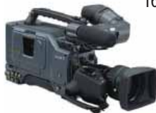
Sony DV Cam WSP 570 165,00 €