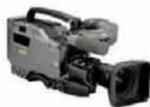
SONY DIGI BETA PVW 709