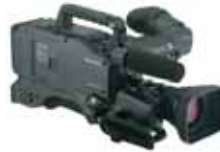
Panasonic AG-HPX 371 P2 HD 180,00 €