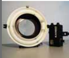
Ringlicht Tageslicht Kunstlicht Dimbar