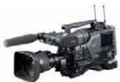
SONY XDCam PDW 700

gefahrne km je 0,40€ * halbe Tage werden zu 70 % berechnet