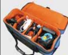
Arri Koffer 2 x 650 W 2 x 300 W Stative