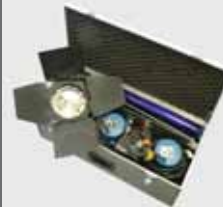
Arri Koffer 3 x 800 W Stative