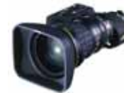
Fujinon HD HA 17x7,6