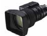
Canon SD YJ20x8.5B IRS