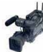
Sony: DVCam WSP 570