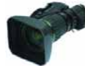
Fujinon HD HA 16x6,3