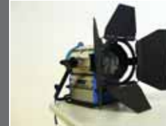
Arri Daylight Compact 575 1, 5 Kw