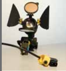
Dedolight Tageslicht Kunstlicht Dimmbar