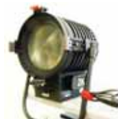
Arri 2Kw Kunstlicht