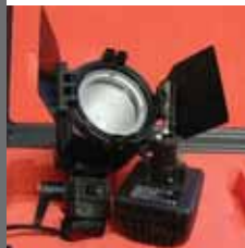
Micro Sun Tageslicht Kunstlicht