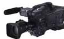
Panasonic: AG-HPX 371