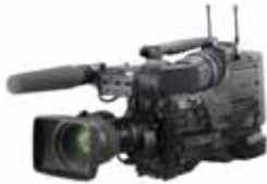
Sony PVW 709 Digibeta 198,00 €