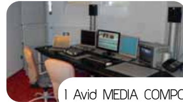
1 Avid MEDIA COMPOSER HD