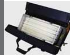
Diva Light 4 x 55 W Kunst/Tageslicht tauschbar